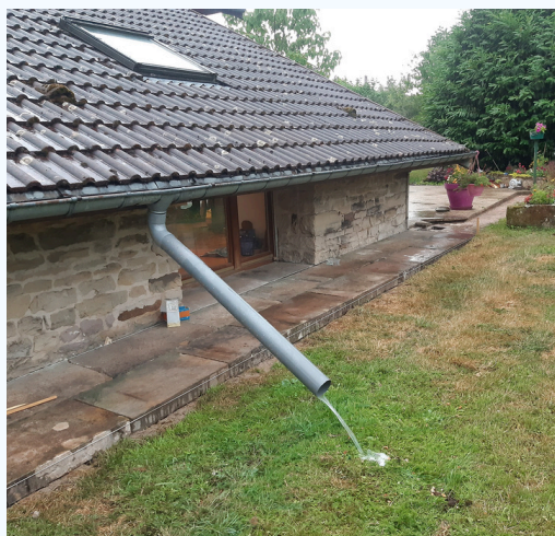
Déconnexion directe par coude