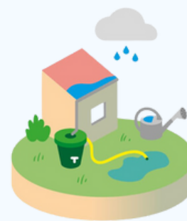
Déraccordement par trop-plein d'une cuve