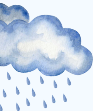
Exemple de photo