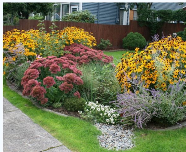
Jardin de pluie

En vous remerciant de l'intérêt porté à la thématique.