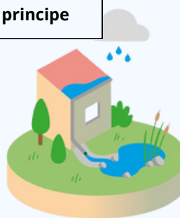
Exemple de principe